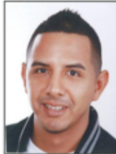
ROSTRO Y CUERPO DE LADO