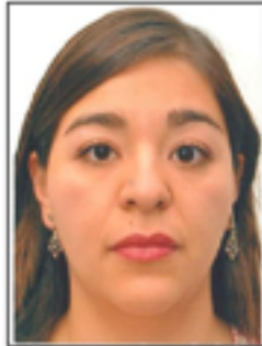
CARA MUY CERCA