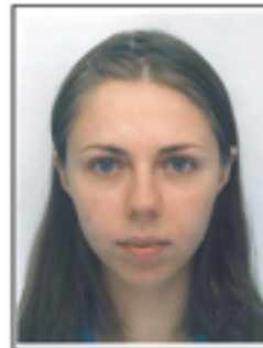
FONDO GRIS O MANCHADO