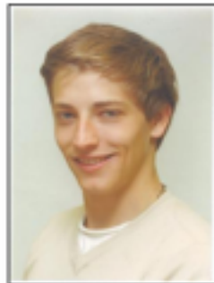
CABEZA MUY LEJOS FOTO DE PERFIL